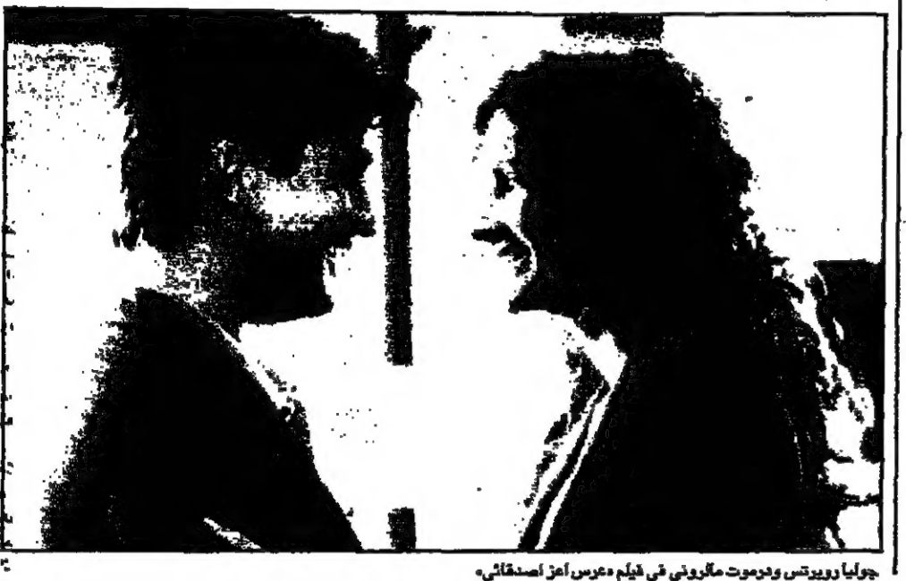
جوليا روبرتس وجمود مارتوني في فيلم عرس اعز اصدقائي